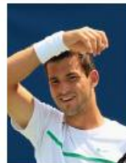
Grigor Dimitrov Bulgarie