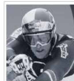
Aksel Lund Svindal