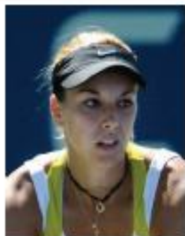
Sabine Lisicki Allemagne